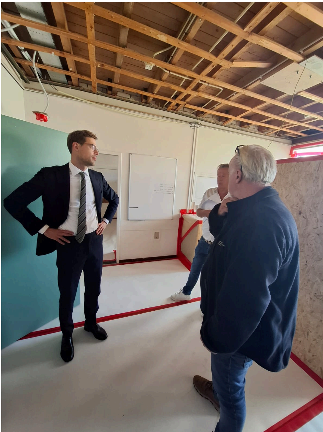
Werkbezoek bij asbestsanering

Naar verwachting opent de internetconsultatie over de wijzigingen in het Arbobesluit in het eerste kwartaal van 2026. Dit is een openbare consultatie en betekent dat iedereen de gelegenheid heeft om te reageren op de voorgenomen wijzigingen. Ook de wijzigingen in het Besluit bouwwerken leefomgeving, het Asbestverwijderingsbesluit 2005 en de Arboregeling zullen worden opgenomen. Alle input wordt door het Ministerie bekeken, waarna mogelijk nog aanpassingen worden gedaan.